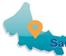
San Luis Potosí